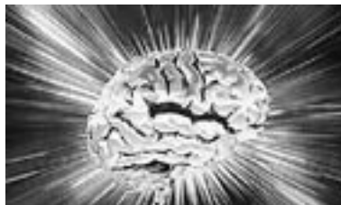
Skeptikoiden aivot reagoivat eri tavalla kuin uskomaan taipuvaisten.

Kokeessa kahden ryhmän piti erottaa toisistaan näytölle nopeasti väläytettyjen oikeiden kasvojen kuvat sekoitettujen kasvojen kuvista.