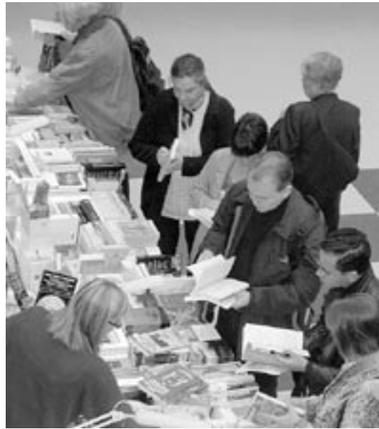
Ajoittaisesta ruuhkasta huolimatta messuilla tuntui käyvän harvinaisen vähän väkeä.

Mitään kummallisia uutuusiakaan ei silmiin osunut, jos sellaiseksi ei lasketa sitä, että yleensä kasvisruokia tarjoilleessa messutapahtumassa oli nyt saatavilla leivän väliin myös eläimen lihasta tehtyä makkaraa. ■