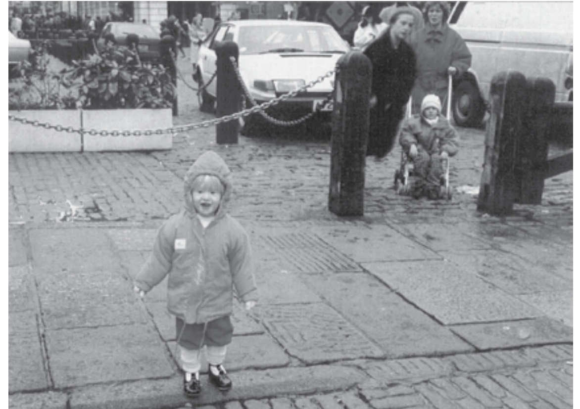
Perhekuvasa leijuva haamu, jota kukaan ei kuvaushetkellä muista nähneensä. Luultavasti ohikulkija, jonka jalat ovat piilossa tukipaalun takana.

- Jos uskon, että kuvassa esiintyy paranormaalialia ilmiö, voimistaako tämä minun uskoani uskontoon, avaruusoloihin tai muihin parapsykologisiin ilmiöihin?