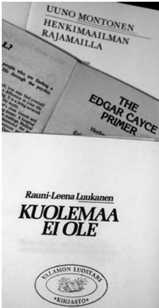
Valamon kirjastosta löytyy vankka pino huuhaata.

mielessäni. Siksi raportti Valamosta on kirjoitettu matkajutun tyyliin.