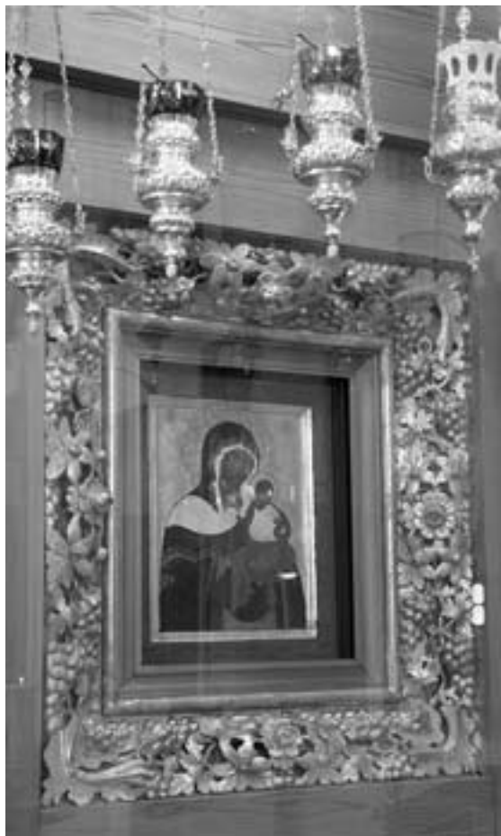
Konevitsalainen Jumalanäidin Ihmeitä Tekevä Ikoni ei tehnyt ihmeitä epäilijälle luostarissa.