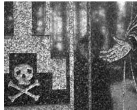
Merirosvokuvio luostarin hautausmaalla muistuttaa ihmisten kuolevaisuudesta.

Meno luostarissa on yllättävän maallista. Hen-