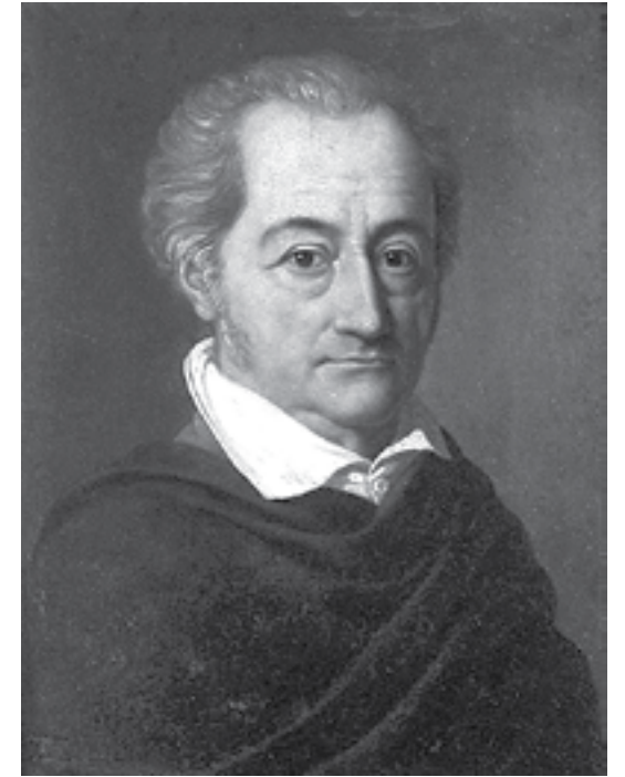
Goethen värioppi on tieteellistä pötyä. Josef Raabe, 1814.

Edes luonto ei osaa tehdä tätä vastaväritempua syksyisin punertuville lehville; punaisen ja vihreän sekoituksesta ei synny harmaata. Miksi ei? Siksi, että väriseoksen havainnointiin eivät osallistu siniseen valoon erikoistuneet näkösolut, joita aina tarvitaan harmaan aistimisessa. Tästä syystä sekoituksesta syntyy aina vain punavihreitä väriyhdistelmiä eli punertavan vihreitä tai vihertävän punaisia. Sanomme niitä tietenkin yleisesti ruskeiksi, likaisen ruskeiksi, oliivinvihreiksi jne. riippuen siitä kumpaa väriainetta nähdyssä seoksessa on enemmän.