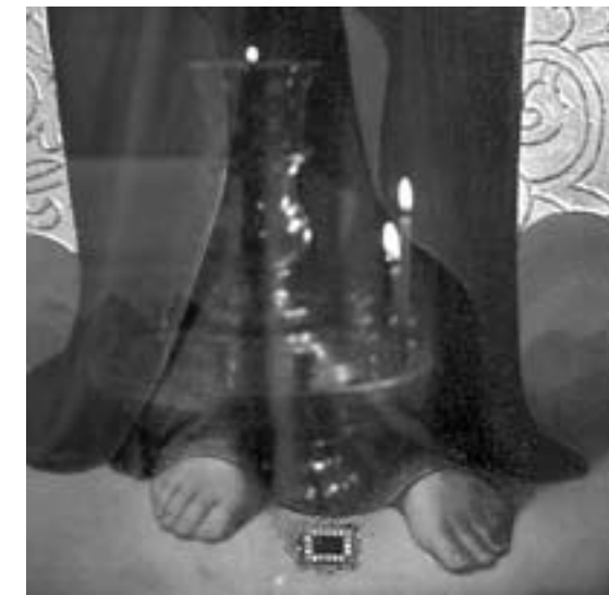
Pala Kristuksen ristiä, pala Neitsyt Marian viittaa. Totta, tarua vai uskon asiaa?

sen nopeuden takia olla lahjakkaankin epäilijän vaikea ymmärtää.