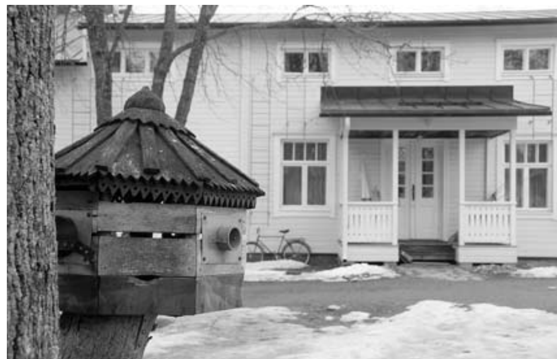
Talkoolaiden asuntola Vanha munkkila.

Ortodoksiuskon hienoin puoli epäilijän mielestä on se, että kilvoittelu on sisäistä. Näkyvän luostarielämän takana kerrotaan sykkivän ihmisten silmiltä salattu kilvoituselämä. Se on tarkoituksellisesti salattu, ei vain vierailta vaan myös luostarin omilta asukkailta. Pyrkimyksenä on kieltäytyä kaikesta ulkonaisesta ja pitää yllä jatkuvaa mielen ja sydämen yhteyttä Jumalan kanssa.