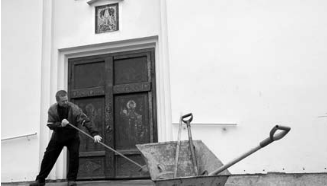
Työllään talkoolainen ja epäilijä maksaa ruoan ja majoituksen.