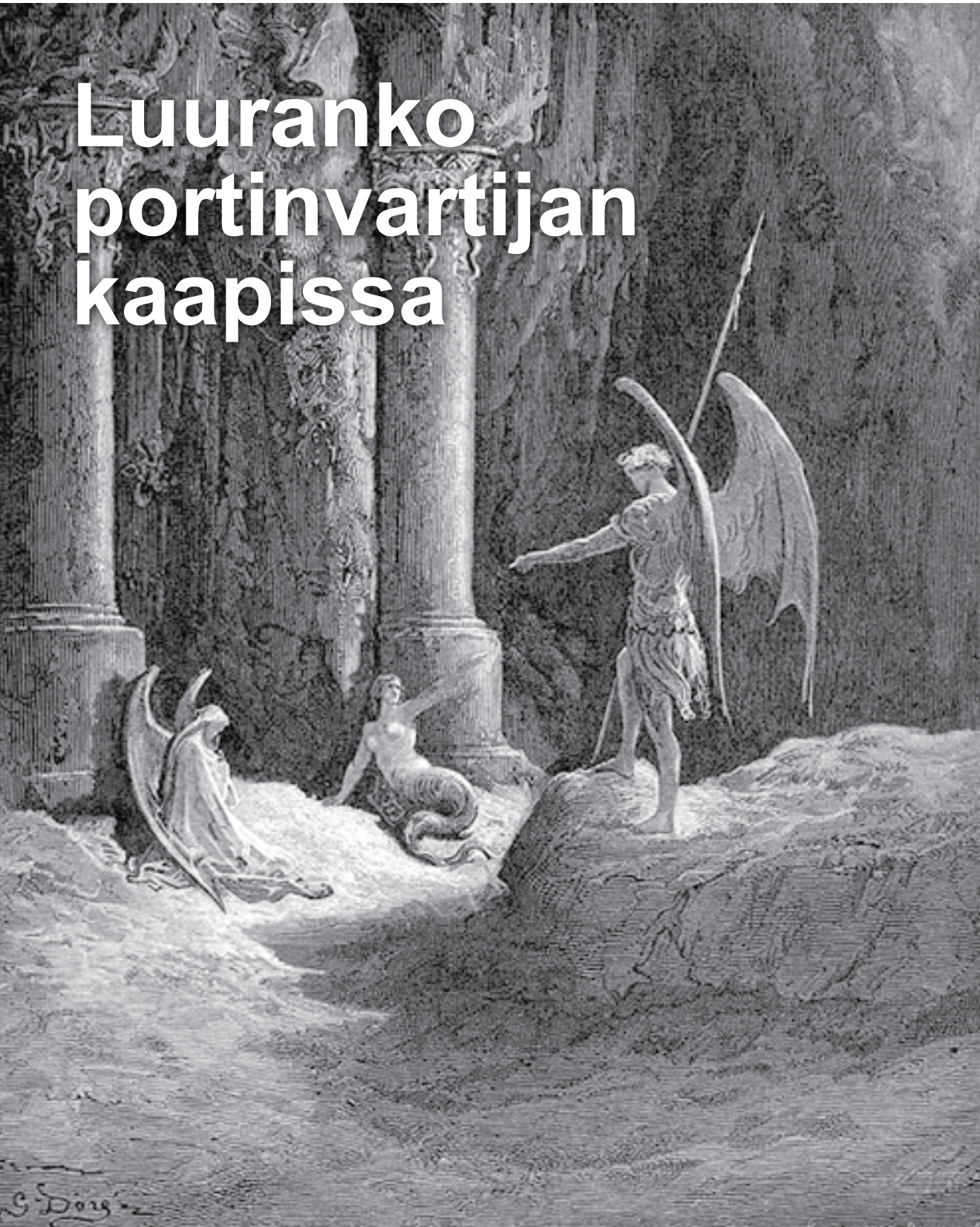
Saatana helvetin portilla. Gustave Doré, 1870.