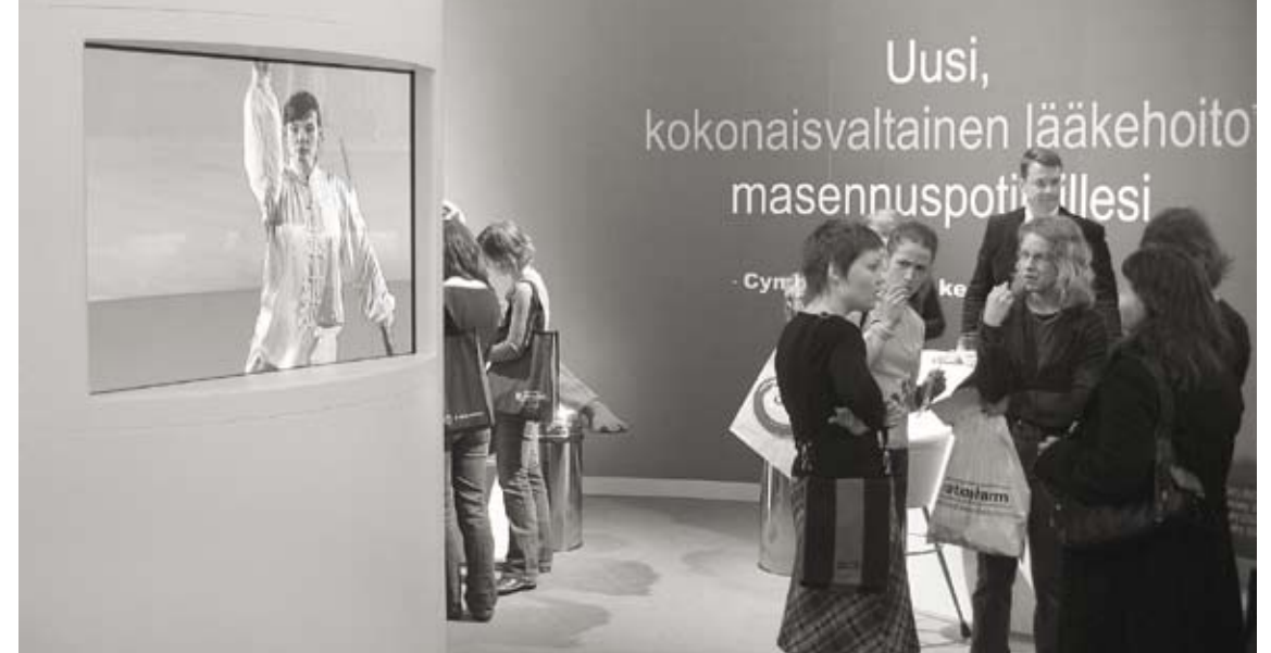
Nainen itämaisissa vaatteissa liikkuu "tasapainoisesti" miekan kanssa. Hengellisyttä yritetään markkinoida nyt myös koululääketieteeseen.

- Tutkimuksen lukemisen jälkeen pitää pysähtyä miettimään, onko tutkimus kun-